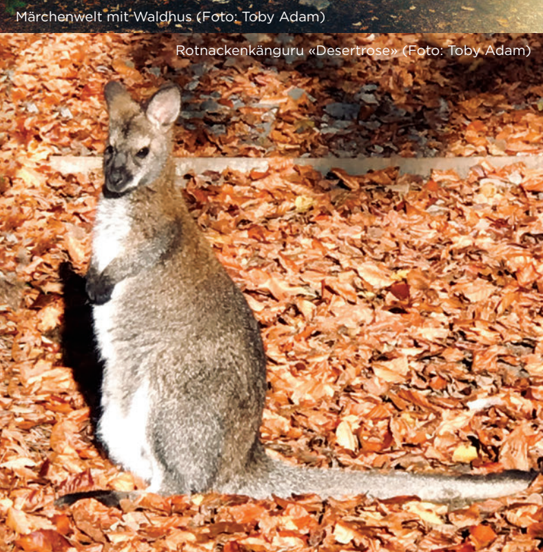
Rotnackenkänguru «Desertrose»