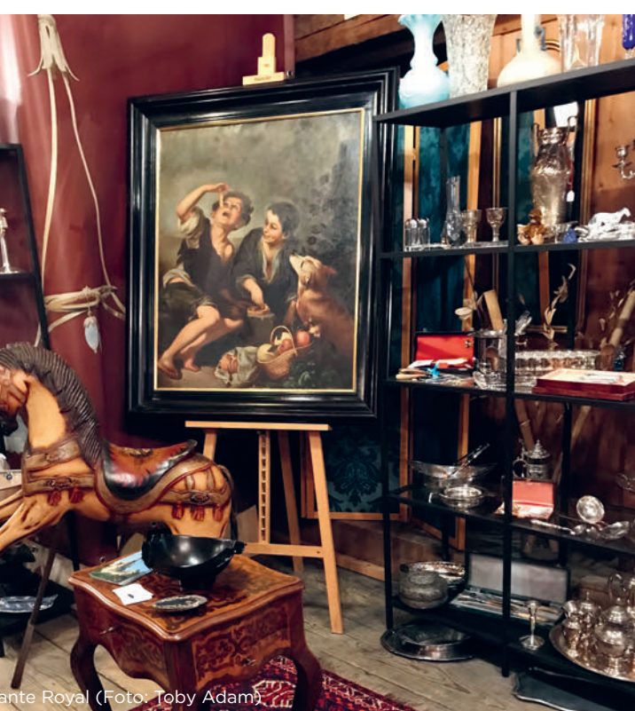
Brocante Royal