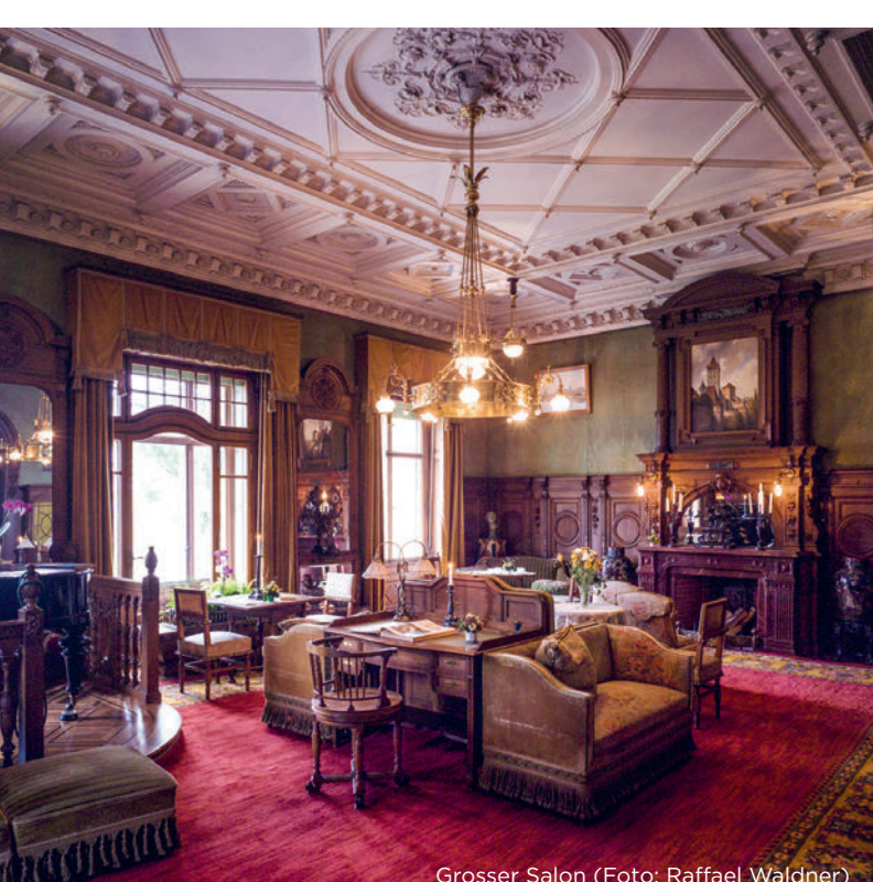
Grosser Salon

«Die Geschichte der Schifffahrt auf dem Thuner- und Brienzsee und der Juraseen», Führung mit Ueli Schneider vom Verein Schiffsammlung Erich Liechti | Museumseintritt