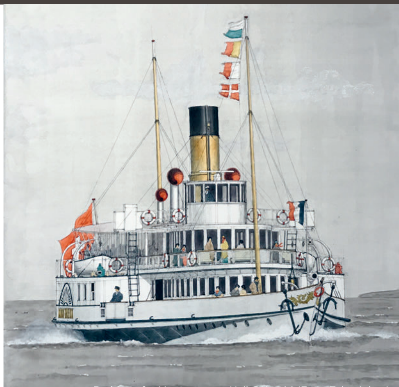
Raddampfer Montreux von Ueli Colombi