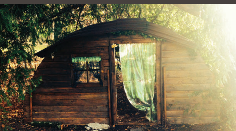
Märchenwelt mit Waldhus