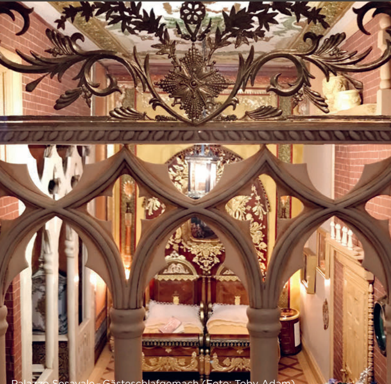
Palazzo Sesavale – Gasteschlafgemach

14.00-16.00 Uhr: «Reisen wie die Vögel» Basteln für Familien | Museumseintritt